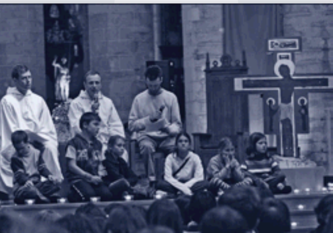
Frère Aloïs, le successeur de Frère Roger, présidant la veillée de prière dans la cathédrale le 3 novembre, dans le cadre du Congrès international Bruxelles Toussaint 2006.

A l'initiative de la COMECE (Commission des Episcopats de la Communauté Européenne), Frère Aloïs, prieur de la communauté oecuménique de Taizé, et quelques-uns de ses frères seront à Bruxelles le 30 janvier 2007. Ils viendront prier avec celles et ceux qui dans cette ville s'engagent pour l'Europe. Ainsi, pendant une journée, la dimension spirituelle du chemin de l'Europe vers son unité sera plus visible, alors qu'en temps normal, les aspects politique et économiques prédominent.